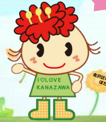
金沢区奉せお届け大使 ほたんちゃん